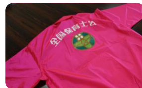
寄贈された スタッフジャンパー

このジャンパーを身につけて、熊本県内の保育士たちが被災地で子どもの育ちを守っている。