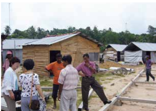
スリランカの修了生の活動先を訪問(スタディツアー)

研修修了生の母国等を訪ね、各国の福祉事情や実践を学び、情報交換を行うスタディツアーや、5年に一度、修了生が一堂に会し、日本の福祉関係者との相互交流を図るセミナーを実施しています。コロナ禍においてはオンラインでの交流会を実施し、修了生との交流を続けました。