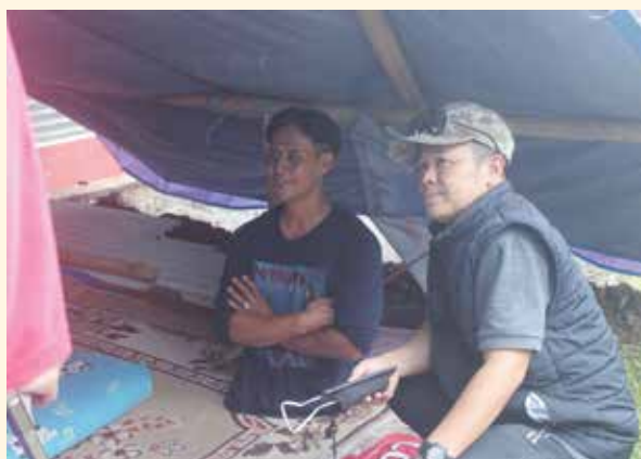
地震被災地で支援活動を行うインドネシアの修了生