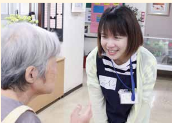
福祉施設で利用者と交流する台湾の研修生

毎年、アジアのソーシャルワーカーを招へいし、全国の福祉施設の皆様のご協力のもと、11か月間にわたり社会福祉について学びを深める研修を行っています。母国の福祉の向上とともに、同じ社会福祉の仲間として、日本とアジアの連携・協力を進める“顔の見える”関係づくりを積み重ねています。研修修了後、修了生を再び日本に短期間招へいするフォローアップ研修も実施しています。