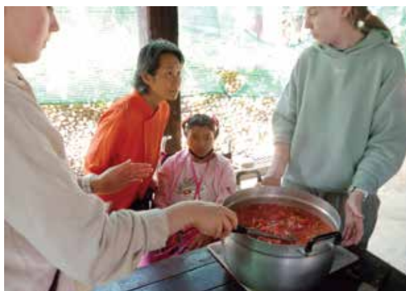
母国タイで子どもたちを支援する修了生