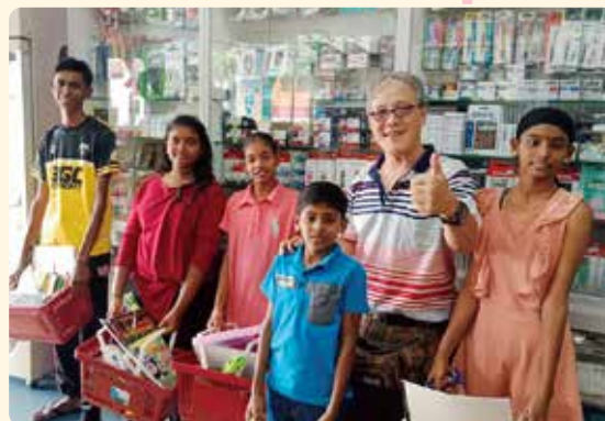
支援を受けて必需品を購入するマレーシアの子どもたち