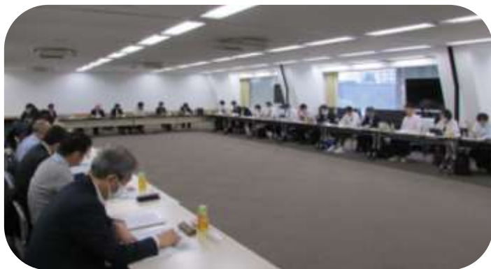
情報共有会議の様子

その後、参加者 35 名 (24 社協) により、県との連携・調整のあり方や財源の確保策、都道府県社協内の組織体制等について意見交換が行われ、財源について「県において災害支援に活用できる基金の積立てを行っている」といった事例や、社協内の人材育成に向けた研修について、「新任職員研修で、社協が災害支援を行う意味に